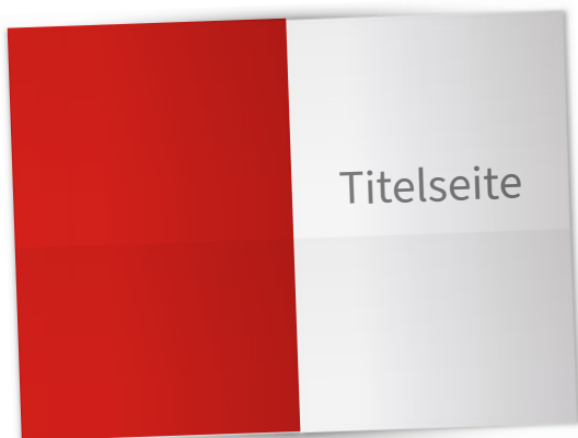
U4 220 x 297 mm + 3mm Beschnittzugabe € 3.490,-