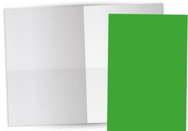
Beilagen 210 x 297 mm bis 30 g € 2.590,-